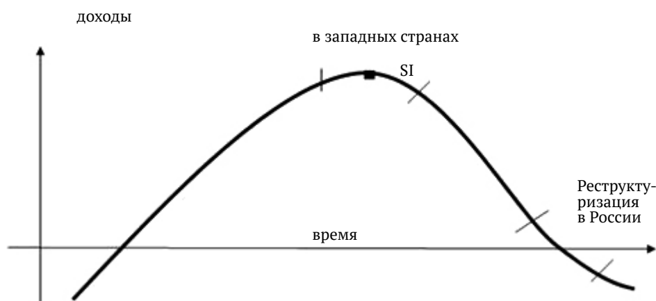
Рис. 1. Кривая жизненного цикла предприятия и стадии, на которых чаще всего проводится реструктуризация в России и за рубежом

На рис. 1 показано, что на участке кривой от отметки SI (финансовой устойчивости) до отметки угрозы банкротства предприятия есть три основные точки: