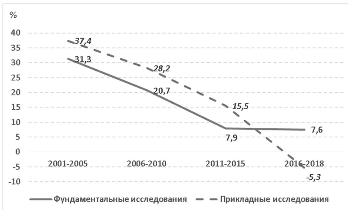
Рис. 2 / Fig 2. Среднегодовые темпы прироста объемов финансирования российской науки из федерального бюджета РФ в 2001–2018 гг.,% / The average annual increment rates of financing of the Russian science from the federal budget of Russian Federation, 2001–2018, per cent