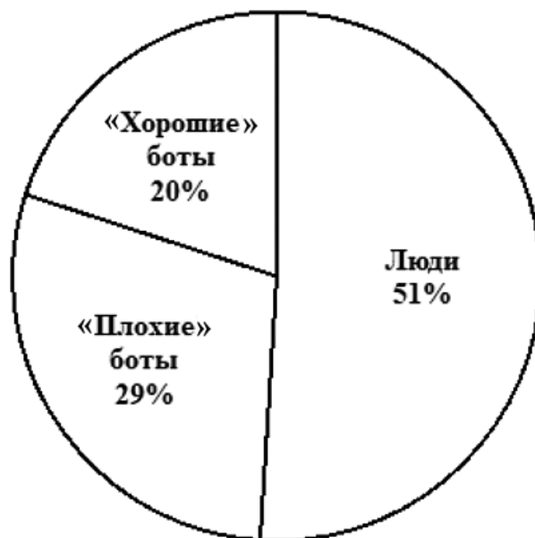
Рис. 1 / Fig. 1. Глобальный интернет-трафик, сгенерированный реальными пользователями и ботами в 2015 г. / Global Internet traffic generated by real users and bots in 2015

Для ботов такое распределение бимодально и имеет максимумы в точках 3 и 7 (количество сообществ). Среднее количество друзей у реальных пользователей оказалось равным 148, что согласуется с числом Данбара. Только 3% пользователей имеют количество друзей больше 250.